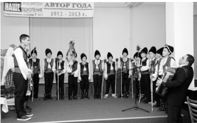
Ансамбль лица «Васил Левски»