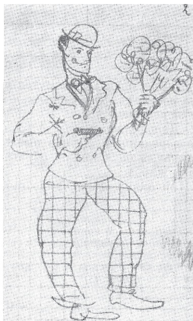
Э.Г. Багрицкий. Беня Крик. 1934 г.

47. Из-под копыт земля летит назад, Но путь закрыт на Елисаветград.