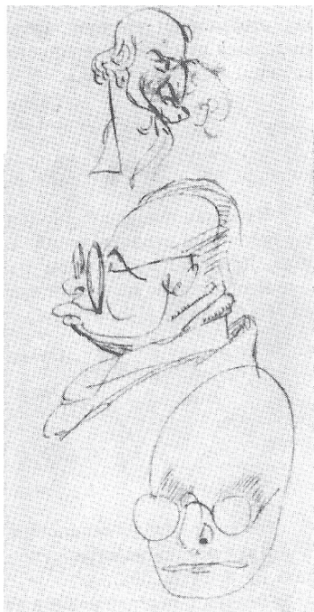
Э.Г. Багрицкий. И.Э. Бабель. 1933 г.

31. Всё, с чем возможна тяга и езда, Ушло на фронт, где гибель и защита, И демон тока выключен из быта И можно смело трогать провода.