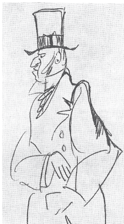
Э.Г. Багрицкий. Чемберлен. 1933 г.

63. Живое торжище избороздив, Но ничего по бедности не тратя, Мы ликвидируем довольно кстати Дарвино-Брэмской страсти рецидив.