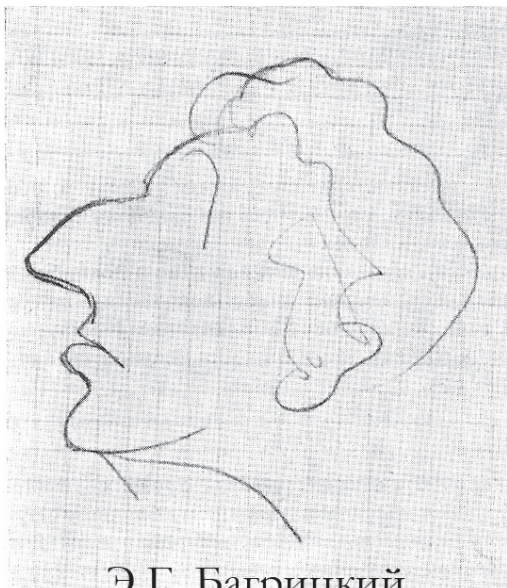
Э.Г. Багрицкий. В.Э. Мейерхольд. 1930 г.

48. Распаян мост, но в тошный плен попасть, Как в клетку клесть, – сомнительная сласть.