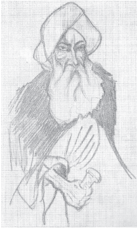
Э.Г. Багрицкий. Старик в чалме, б. д.

70. Он со двора стучится к ней в окно, Авось ей «захотится», этой цаце, «Пройтись» с ним под ручку вдоль акаций По улицам, где пусто и темно!