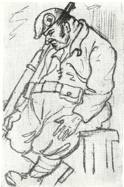
Э.Г. Багрицкий. Национальный гвардеец 1933 г.

25. Отплясывают запахи в ноздрях, Тиранствует летучее добро в них, И, фыркая, бормочет на жаровнях Съестной товар промасленных нерях».