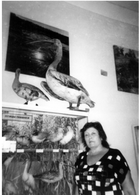
Историко-краеведческий музей Белгород-Днестровский, А. Стулина

Лето – пора пикников. По традиции здесь делают шашлычки из мидий, куриного филе, говяжьей и свиной вырезки. Вариантов приготовления шашлыка очень много. Запекают также овощи – синие баклажаны, помидоры, перец, лук. Всё это запивают великолепными винами. И, может быть, у вас возникнет желание побывать в Шабо, совершить путешествие во времени на 200 лет назад, когда швейцарские переселенцы посадили там первый