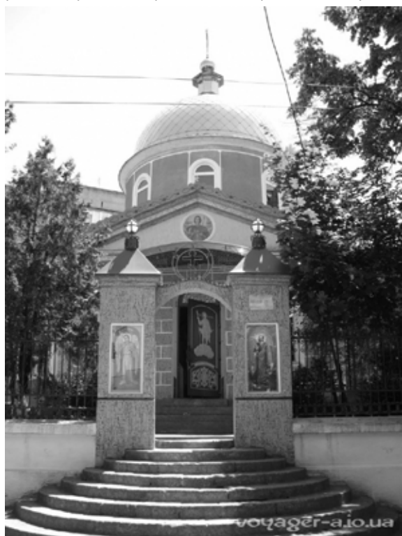
Свято-Георгиевская церковь(болгарская) 1840 года

Много лет назад читатели пришли сюда впервые, а сейчас идут с детьми и внуками. В 1953 году строители железнодорожного моста в свободное от работы время построили и подарили посёлку Дом