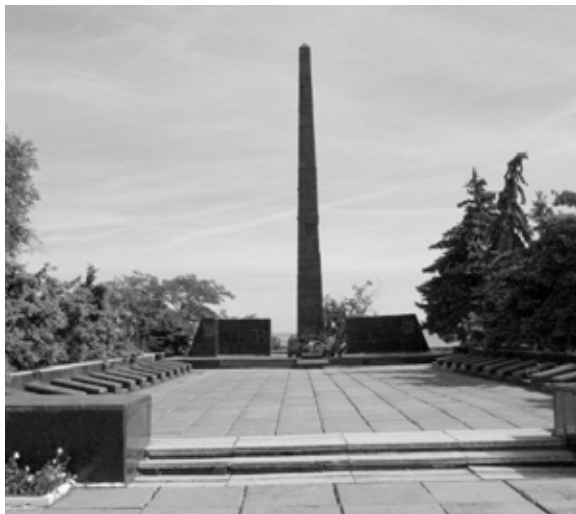
Мемориал воинской славы Белгород-Днестровский

ев работают на науку. Высокоталантливые актёры зрелищных представлений трудятся для публики. Им восторженно аплодируют дети и взрослые. Прыжки через охваченные огнём обручи, пение под аккомпанемент, игра в футбол, бейсбол, баскетбол, катание собак на плотиках. Это обученные дельфины. Но даже недрессированные ведут себя раскованно и непосредственно. Дразнят рыб, хватая их за хвост, ныряют за разными предме-